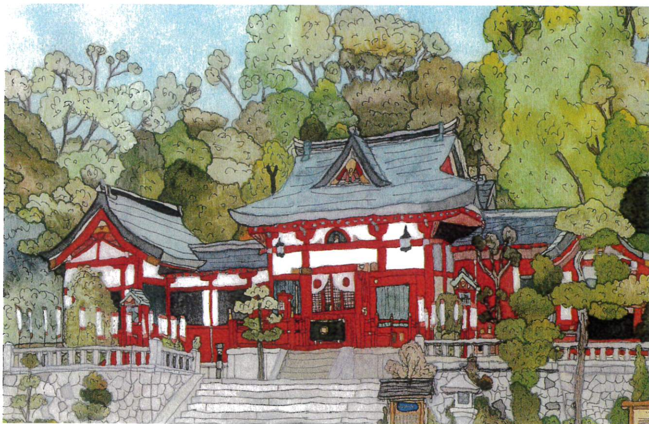
川島直人作「織姫神社」(足利市)